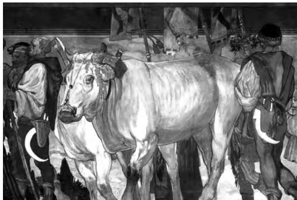
Galileo Chini, Allegoria dei lavori agricoli , particolare (Arezzo, Archivio di Stato)

Parzialmente accessibile ai disabili. Partecipazione gratuita. Prenotazione preventiva alla Società Storica Aretina fino ad un massimo di 60 visitatori (con precedenza per i soci SSA ed un accompagnatore).