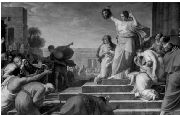
Pietro Benvenuti, Giuditta che mostra la testa di Oloferne al popolo di Bethulia , particolare (Arezzo, Duomo, Cappella della Madonna del Conforto)

Parzialmente accessibile ai disabili. Partecipazione gratuita. Prenotazione preventiva alla Società Storica Aretina fino ad un massimo di 60 visitatori (con precedenza per i soci SSA ed un accompagnatore).